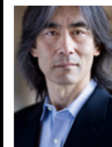
Kent Nagano (Musikalische Leitung)

Besonders war Poulencs Vorliebe für Vorstadtmärkte, Cabarets, Jahrmarktsmusik, Clownerien, Music-Hall, Vaudeville – alles zwielichtige, schillernde, ironische Oszillieren zwischen Satire und Melancholie. Dabei gibt es eine Parallele zu Kurt Weills Technik der Verarbeitung fremder, nicht-akademischer Idiome, afrikanischer Einflüsse ( Rapsodie nègre ), Jazz. Womit wir wieder bei molto agitato wären und bei Weills Sieben Todsünden .