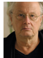
Frank Castorf (Inszenierung)

gilt als einer der herausragenden Dirigenten sowohl für das Opern- als auch das Orchesterrepertoire. Er war Musikdirektor des Berkeley Symphony Orchestra, der Opéra National de Lyon, des Hallé Orchestra und der Los Angeles Opera sowie künstlerischer Leiter und Chefdirigent des Deutschen Symphonieorchesters Berlin. Von 2006 bis 2013 war er Generalmusikdirektor der Bayerischen Staatsoper. Seit 2006 ist Kent Nagano zudem Musikdirektor des Orchestre Symphonique de Montréal, seit 2013 auch Erster Gastdirigent der Götterberger Symphoniker. Er gastiert regelmäßig in allen wichtigen Musikmetropolen. Seit 2015/16 hat er aus Kalifornien stammende Dirigent das Amt des Hamburgischen Generalmusikdirektors inne, im Oktober wird er auch die Musikalische Leitung des Doppelabends Pierrot lunaire/La voix humaine übernehmen.