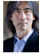
Kent Nagano (Musikalische Leitung)

Die Frage, warum in den Sieben Todsünden keine Hits sind, bleibt hier unbeantwortet. Oder beantwortet sich selbst: die Leichtigkeit des Tanzes auf dem Vulkan von 1927 war weg, drei Jahre später war der Ernst der politischen Lage zunehmend spürbarer und der eigene Eskapismus und die Amerika-Begeisterung von Brecht war geschwunden. Weill konnte nicht mehr in Berlin bleiben, und Brecht ahnte wohl, dass er mit Walter Benjamin, den er nicht so recht mochte, in Dänemark die Zeit totschiagen musste mit endlosen Schachpartien.